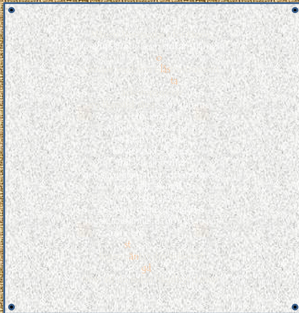
Dans på Regia Carolinska ur "Det lärda Zoot" 1986